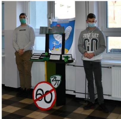
zwycięski Kłokocin, klasa 3 Tm